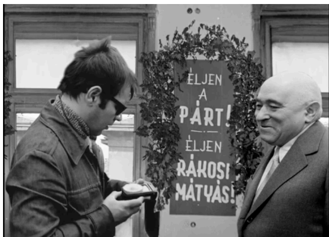
„A valódi archív felvételek és a mesterségesen előállított ál-archív jelenetek tudatos keverése” – részlet a Dublőr ből (2. kép)

láthattuk Orosz korábbi „dokumentumlegenda” kísérletében az Ah, Amerika! -ban, 20 ahol a dokumentumfilm tradicionális eszközeit összekapcsolja animációs és interpretatív rétegekkel. Orosz a Dublőrben hol eredeti történeti dokumentumokat – képi vagy hangyi anyagokat –, hol pedig ezekre emlékeztető, hitelesnek tűnő, de valójában fikciós elemeket (például kitalált interjúalanyokat vagy stilizált, régi felvételeket imitáló jeleneteket) használ. Ez a montázstechnika szándékosan elbizonytalanítja a nézőt, és többrétegű befogadói élményt teremt. A valós archívum referencialitása hiteles történeti kapcsolódást kínál, míg az álarchívum a dokumentumfilm formai nyelvét idézve játszik rá az igazság illúziójára. E kettősség révén a film folyamatos reflexióra készíti a nézőjét, hiszen nemcsak a történelmi valóság, hanem annak reprezentációja is kérdésessé válik.