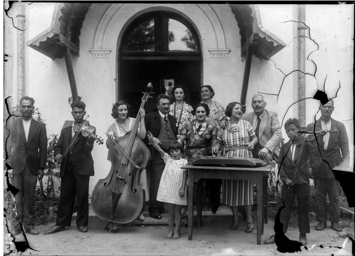
„...a családtagok egyike, egy kislány, Hitlert köszöntő karlendítéssel üdvözlí a kép készítőjét” – részlet a The Dead Nation ből

absztrakcióvá roncsolódtak, amikor pedig a zsidó emberek elgázosításáról beszél, képek helyett a szakadatlan feketeség közjátékát láthatjuk.