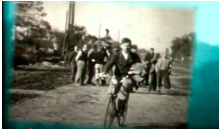
„...archívum az archívumban” – részlet Az örvény című filmből (4. kép)

megragadhatatlanságát. Ha Lanzmann a tanúságtétel etikáját hangsúlyozza, Forgács inkább a képi rétegek archeológiáját tárja fel: a Shoah az emlékezés jelenidejősége, míg az Az örvény a múltban rögzült látvány későbbi újrarahangolása felől közelít ugyanazon morális kérdésekhez. Két eltérő esztétikai paradigma, mégis hasonló céllal: a történelmi trauma mozgóképes újragondolása az oral history és a képhasználat határvidékén.