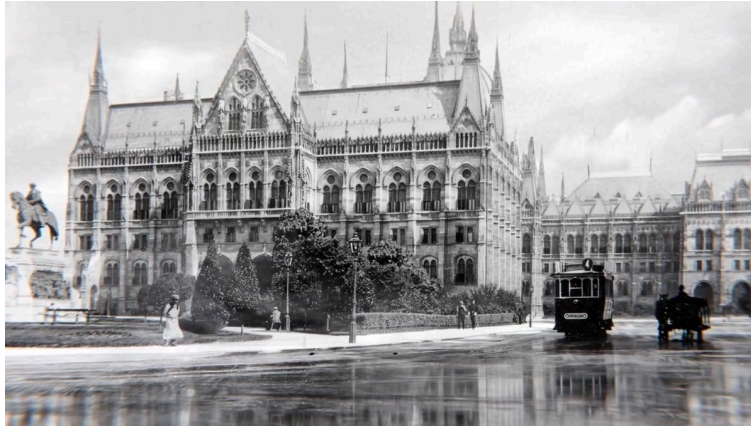
„image-film és a dokumentumfilm határvonalán egyensúlyoz” – részlet a Budapest születése című filmből (16. kép)