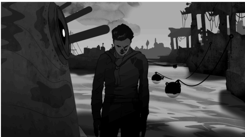
„A lengyel katonák kalandjait is a képregényszerű animáció stílusában mesélik el” – részlet a Wartime Portraits -ből (14. kép)

A fotóalapú mozgás helyett a Wartime Portraits -ben a lengyel katonák kalandjait is a képregényszerű animáció stílusában mesélik el, ám Medgyesi filmjéhez képest a szereplők mozgása itt folyamatos. Az animátorok, Agnieszka Boryczko és Jacek Kościuszko főleg sötét tónusú grafikus képei hangulatukat tekintve is zökkenőmentesen kapcsolódnak a háborús archív felvételekhez. A szürke különböző árnyalatai és az animált szekvenciák fény-árnyék kontrasztja meggyőző stílusjegységet alkot a régi, valós fotók és filmfelvételek realista hatásával, így a film képi világa a teljes játékidő alatt koherens marad.