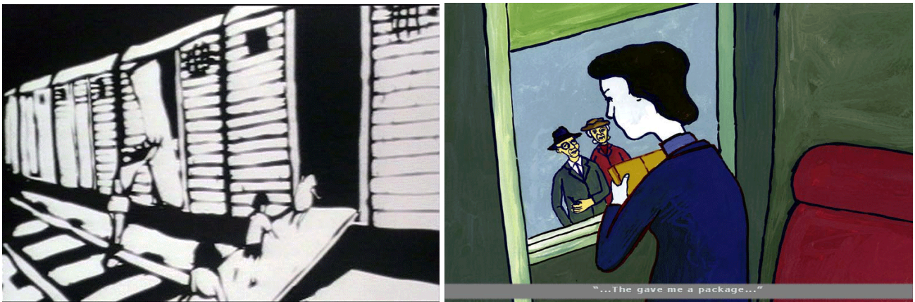
„Fekete-fehér képkockákon a terezini tábori részek láthatóak, míg a poszt-háborús svédországi visszaemlékezés már színes” – részletek a Silence -ből (11-12. kép)

marhavagonokká, az ajtót nyitó kalauz pedig a tábor egyik őrévé változik, igaz csak villanásnyi időre. 61 A két stílus kontrasztja tehát folyamatosan jelen van, egyfajta képi diszharmoniót teremtve: a durva fekete-fehér, egyszerű vonalak jelentik a koncentrációs táborok megfoghatatlan világának ábrázolását, szemben az úgynevezett történelmi valósággal. Pedig a táborral kapcsolatos traumák pont így válnak valóságossá, az asszociációk folyamatos, visszatérő felvillanásaival. Ez lehetővé teszi a film számára, hogy a koncentrációs táborokat megfoghatatlan ürességként reprezentálja, de az üresség egyben a megélt valóság is, amely folyamatosan visszatér, hogy megragadjon valamit a jelennel kapcsolatban.