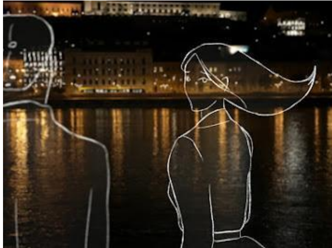
„...a túlélők tanúságtételéről szól” – részlet a Még emlékszem ből. (13. kép)

A hiányzó arcok sora pedig maga a történet, s az egyénileg elszenvedett tapasztalat, a személyes tragédia közös sorsunkká válik. A személyesből a kollektív emlékezetbe való utat „poszttraumatikus diskurzus” során járjuk be, ami Joshua Hirsch teoretikus szerint „egy olyan diszkurzív teret és nyelvet biztosít, amellyel elkezdhető az átélt reprezentációs kudarc megjelenítése, és amely ezt felhasználva lehetőséget teremt egy kollektív válasz felé való elmozdulásra” . 63