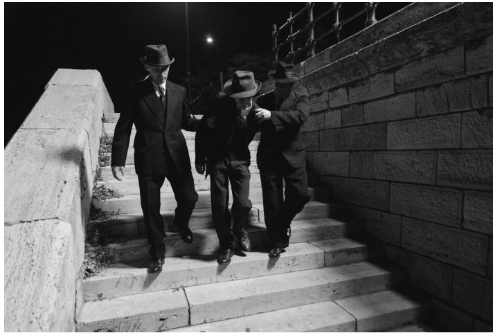
„A szereplők élszereplős jelenetekben, stilizált hátterek és gyakran statikus, képregényszerű kompozíciók előtt jelennek meg –” részlet A 26-os számú holttest című filmből (15. kép)

élszereplős alakításokat kifejezetten animált, grafikus hátterekkel kombinálják. Mindkét megközelítés a történelmi hitelesség és a dramatikus jelenlét egyensúlyára törekszik, vizuális eszköztáraikon keresztül fokozva a karakterek filmszerű jelenlétének hatását. A díszletszerű, absztrakt, vagy digitálisan konstruált terek ezáltal nem pusztán esztétikai választások, hanem a történelmi elbeszélés stílusbeli és értelmezési irányait is kijelölik.