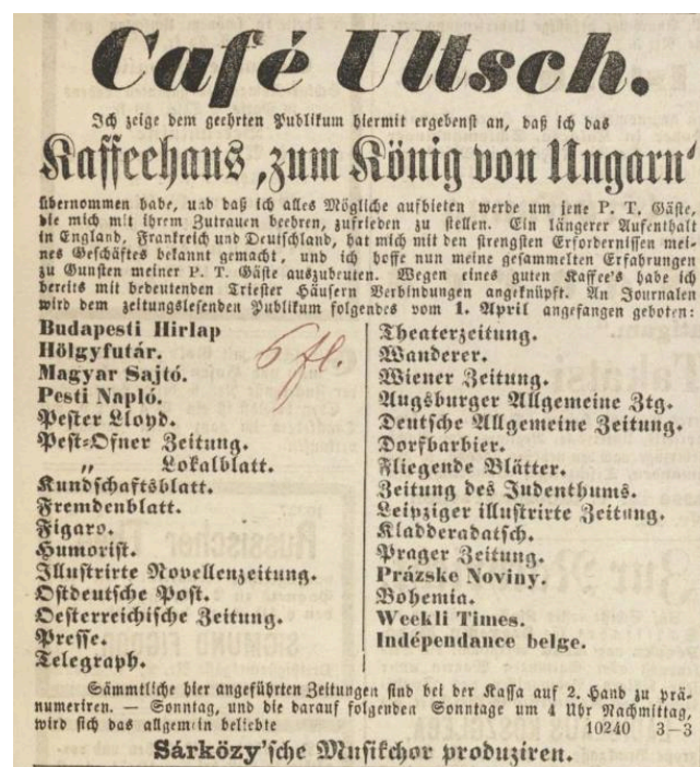
1. ábra. Az Ultsch-kávéház hirdetése a Pesth-Ofner Localblatt und Landbotéban, illetve a Pester Lloydban 257

Az újabb sajtókutatások nyomán eredményesen kérdezhetünk rá arra is, hogy az egyes zenei színtereken milyen lehetőség volt a lapok terjesztésére. Ezzel kapcsolatban érdemes a lapok és folyóiratok hirdetésrovatát megnézni. Egy-egy új kávéház megnyitásának hirdetését illetően felmerül a kérdés, mit tarthattak fontosnak kiemelni egy sikeres üzlet reményében. A korábbi Magyar királyhoz címzett kávéházat átvéve, az új tulajdonos 1857-ben Café Ultsch néven nyitotta meg új kávéházát. A vendéglős külföldi (angliai, francia- és németországi) tapasztalatainak, trieszti kapcsolatainak kiemelése, valamint Triesztből szerzett kávéjának hangsúlyozásán túl hírlapelőfizetéseinek listájával reklámozta magát. (1. ábra) A hirdetésen a kávéházak még egy további vonzerejét kiemeli: a rendszeres zenekari fellépést, amelyet az Ultsch-kávéházban minden vasárnap délután 4 órától a Sárközy Ferenc által vezetett cigányzenekar szolgáltatta.