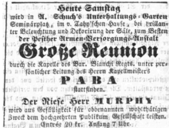
4. ábra. A Pesth-Ofner Localblatt und Landbote egy hirdetése, 1857. szeptember 5.

A hirdetések kiemelése elsődleges, hiszen ez alapján sikerült egyáltalán a pest-budai zeneélet szerkezetének működését szélesebb perspektívában felvázolni. Csak hogy az arányokat illusztráljuk: a zeneoktatással kapcsolatban 54, a reuniókról 446, a vendéglátóipari egységekben és kerthelyiségekben rendezett soirée -król 212, koncertekről 12, a nemzeti színházi előadásokról 175, a német színházi előadásokról az összes színtér vonatkozásában 361 hirdetést találunk, míg a táncvigalmakról és bálokról 187 darabot. Ilyen például az A. Schuch's Unterhaltungs-Garten helyisége, amely júniustól januárig fogadta a vendégeket, ahol hetente katonazenekarok, valamint melophonjátékosok és énekesek működtek közre. 418