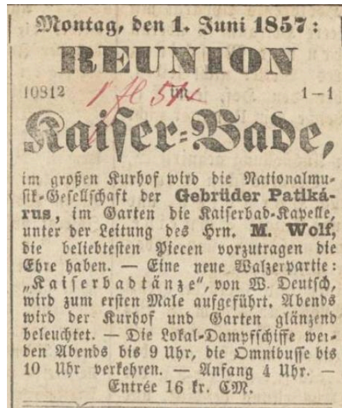
7. ábra. A Császárfürdőben rendezett első reunió 1857. június 1-én

A két együttes a közönség legkedveltebb darabjait („die beliebtesten Piecen”) játszotta, valamint egy új táncot, a „Kaiserbadtänzét” a helyi amatőr zenész-zeneszerzőtől, Willibald Deuschtól. A Pester Lloyd ban, valamint a Pesth-Ofner Localblatt und Landboté ban fennmaradt hirdetések alapján a fürdőudvart, valamint a kertet kivilágították. Az eseményre délután 4 órától lehetett érkezni, és 16 krajcár ellenében belépni. A gőzhajók este 9-ig, az omnibuszok este 10-ig közlekedtek. 700