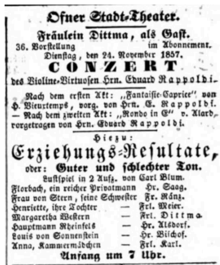
6. ábra. Pesth-Ofner Localblatt und Landbote, 1857. november 24.

A bécsi születésű Eduard Rappoldi (1839–1903) hegedűművész 1857. november 20-án érkezett Pestre. 555 Érkezését követően november 24-én a budai Várszínházban adott koncertet a felvonások között: Henri Vieuxtemps Fantaisie-Caprice , majd a következő felvonásban Delphin Alard rondóját adta elő. 556 A tervek szerint a Nemzeti Színház színpadán is fellépett volna, 557 azonban a színlapanyagon és a sajtóban sem találunk erre vonatkozó további megjegyzést.