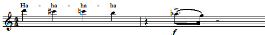
8. kottapélda Rudy Wiedoft: Sax-o-Phun 1. üteme és Kodály Zoltán: Háry János szaxofonszólójának első motívuma 60

felhívószóval fortissimo lép be. Az akcentuált nyújtott ritmus olyan, mint egy kiírt glissando. Kísértetiesen hasonlít ez a motívum egy Rudy Wiedoft által népszerűsített technikára, a nevető-effektusra, 59 ami lényegében egy félhangra lehajló glissando. Wiedoft Sax-O-Phun című művének ez a fő eleme, megszólaltatva nagy hasonlóságot mutat Kodály által lejegyzett gesztussal.