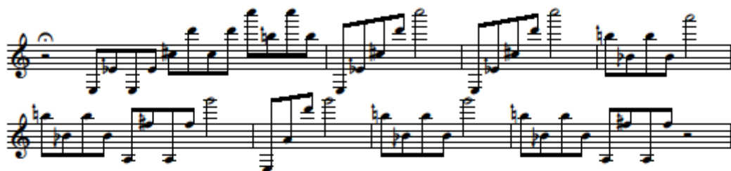
16. kottapéllda Concerto I. tétel 77-84. ütemei, a Cadenza senza misura első nyolc taktusa

A 77. ütemben egy hosszabb cadenza kezdődik, amelynek a kiinduló frázisa, az első cadenza senza misura zenei anyaga. Maros a kezdeti mottót használja kiindulásul és ezt bontakoztatja ki a következő húsz ütemben. Ez a motívum nagy hangközlépésekből áll, amelyek felkapaszkodnak az altissimo regiszterbe, rendszerint negyedhangokat használva köztes lépésként.