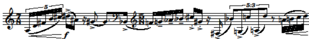
9. kottapélda Snatches of Conversion szaxofon szólamának 221-223. ütemei

Az artikulációs jelzések széles palettájának egy mintája a Snatches szaxofon szólamának 221-223. ütemig tartó motívuma.