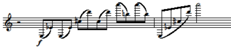
14. kottapélda Concerto mottója, első megszólalása: 17-18. ütem

A Concerto első tételében a tizenhat ütemnyi zenekari bevezető után lép be a szaxofon, ez a két ütemnyi frázis lényegében a concerto mottója, időről időre felbukkan a darab során. Hol egy az egyben, hol pedig részleteiben, máshol pedig a transzponált mottótöredék ismerhető fel a szaxofon zenei anyagában.