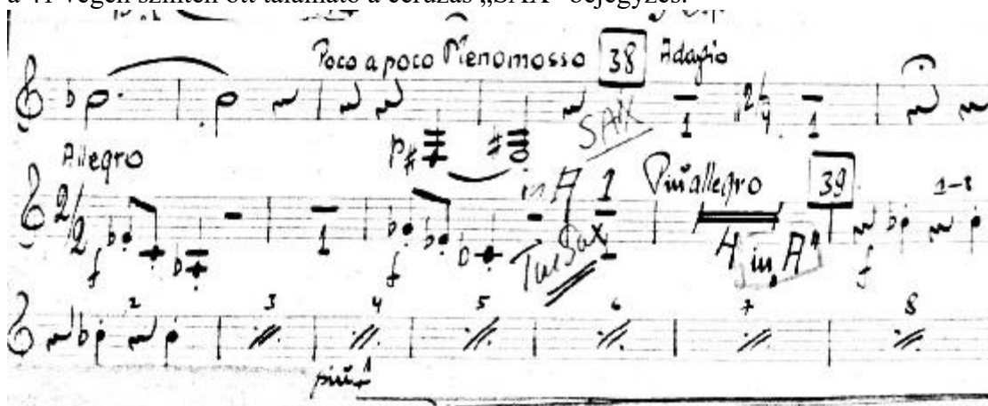
3. kottapélda A Fából faragott királyfi 1. klarinét szólamának részlete (38. szám) - eredeti szólamkotta

Valószínűleg egy figyelmeztetés a játékosnak, hogy vegye fel, vagy helyezze el úgy a hangszert, hogy gyors váltással alkalmazni tudja. Hiszen a 42. szám előtt egy negyednyi szünete van arra, hogy felvegye a szaxofont. Később még ennyi sincs, hiszen a szólamok fedik egymást. Talán egy-egy záróhang lerövidítésével és az első futam kihagyásával oldhatta meg a klarinétos ezt a feladatot. Az eredeti dallam alatt ceruzával bővített kvarttal lejjebb is le van kottázva a dallam.