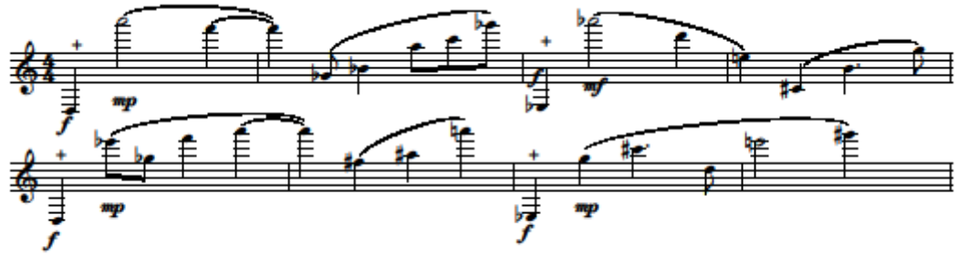
25. kottapélda Burattinata 55-62. ütemek szaxofon dallama

A szaxofon nagy hangközlépésekből álló dallamot játszik, a legnagyobb ugrás az induló kis D-A 3 lépés, ami három és fél oktávot lép át. A nyolc ütemes dallam kétszer négy ütemnyi frázisból áll, amelyek egy mély slap hanggal indulnak, a frázisok 2. hangja szinte mindig az altissimo regiszterben helyezkedik el, és onnan nagy ívekben szeli át a szaxofon majdnem négy oktávnnyira kiterjesztett hangterjedelmét. Ezt a dallamot a zongora komplementer akkordfelbontásokkal kíséri. Az első két ütem két hármashangzata G-H-D a balkézben és Cisz-E-Gisz a jobbkézben. A következő két ütemben pedig F-A-C és Esz-Gesz-Bé hármashangzatok felbontásai hallhatók. Ezek együttesen a kromatikus skála minden hangját magukba foglalják. A következő négy ütem kísérete az előző négy megismétlése.