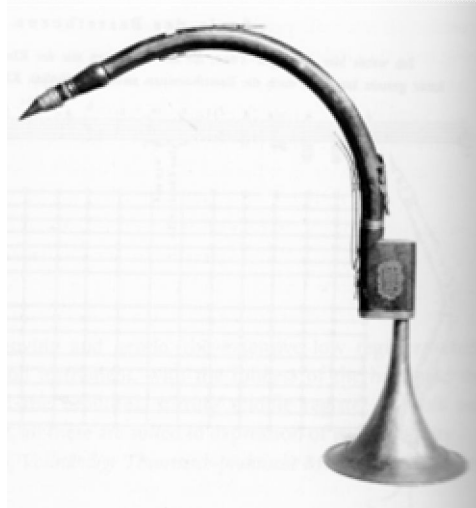
5. sz. ábra: basszetkürt (Mayrhofers, Passau)