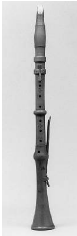
3a ábra: négybillentyűs C klarinét

A következő jelentősebb lépést Berthold Fritz 1750 körül bevezetett újításai jelentették. Egy negyedik és egy ötödik billentyűvel látta el a klarinétot: a kis fisz és gisz, átfújva cisz” és disz” hangok megszólaltatása vált így lehetővé (lásd 3. és 4. sz. ábra).