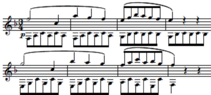
Mozart: Esz-dúr szimfónia , K.543, 3. tétel: Menüett, 1-8. ütem

Legközelebb a K.385-ös Haffner-szimfónia (1782) második, bécsi változatába (1783), a két szélső tételbe emel be klarinétokat a szerző. Ezek a szólamok technikailag könnyűek, elsősorban a tutti szakaszok erősítésében vesznek részt. Később az 1788-ban keletkezett, K.543-as Esz-dúr szimfóniában találkozunk klarinétokkal. Ennek a szimfóniának az az érdekessége, hogy az oboákat teljesen elhagyja a fafúvósok közül, és a klarinétokat olyan szólisztikus feladatokkal bízta meg, amilyenre eddig szimfonikus alkotásban nem láttunk példát. Legismertebb részlet a harmadik tétel triója, melyben az 1. klarinét dallamához, melyet a fuvola echo-szerű motívuma egészít ki, a második klarinét Alberti-basszus-szerű, folyamatos nyolcadmozgásos kísérete társul: