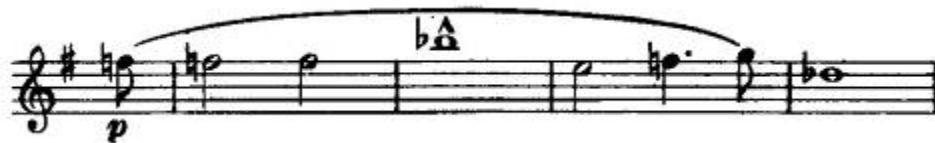
Wagner: Tannhäuser , nyitány, Vénusz vezérmotívuma klarinéton

És ha már az operairodalom gyöngyszemeinek klarinétos vonatkozásairól van szó, nem szabad említés nélkül hagyni Wagner Tannhäuser című operájának (1845) nyitányát sem, mely a kürtök, klarinétok és fagottok ünnepélyes szextettjével indul (lásd Függelék, 185. oldal). A Wagnerre jellemző Leitmotiv-technika ebben a műben is jelen van: az egyik, az opera során több ízben visszatérő témát – a Vénusz csábító énekét szimbolizáló vezérmotívumot – a klarinét mutatja be először, terjedelmes szólót kerekítve belőle: