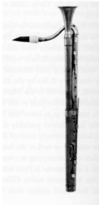
7. sz. ábra: basszusklarinét (Grenser, Dresden)

Az 1790-es években kísérleteztek ki a drezdai Grenser műhelyben egy olyan modellt, ami áttörést hozott: a fagotthoz hasonlóan két párhuzamos csővé hajlított furattal már kezelhetővé vált a hangszer (lásd 7. sz. ábra).