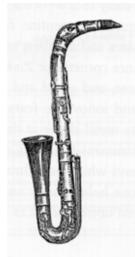
8. sz. ábra: basszusklarinét (Desfontelle 'Clarinette conique à douze clés' elnevezésű hangszere) 7

Előfordultak ezen a kettőn kívül más próbálkozások is, a legkülönfélébb, invenciózus megoldásokkal a hosszú cső összehajtogatására. Álljon itt egy példa, érdekességképpen, egy itáliai hangszerépítő, Nicola Papalini alkotása (lásd 10. sz. ábra):