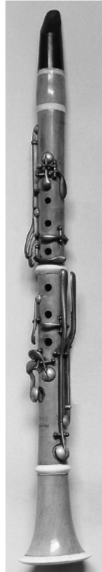
14. sz. ábra: tizenhárom billentyűs Müller-rendszerű klarinét

Ezekkel a fejlesztésekkel a továbbiakban szükségtelessé vált, hogy különböző hangnemű művek esetében más-más, megfelelő hangolású hangszert használjanak, hiszen ezek a hangszerek már a kromatikus skála minden hangját szinte mindenféle kombinációban könnyedén meg tudták szólaltatni, tehát minden hangnemben játszhatók voltak, nem csak a kvintkörön az alaphangsorukhoz közel eső hangnemekben, mint a korábbiak. Az általánosan elterjedt alaphangszer a B klarinét lett, ezen kívül gyakran használták még az A- és a C klarinétot is. Ebben a formájában lett a klarinét igazán sokoldalúan használható zenekari hangszer, és foglalta el egyenrangúként a helyét a fuvolák és az oboák mellett a zenekarokban. A 13 billentyűs klarinét egészen a 20. század elejéig volt használatos.