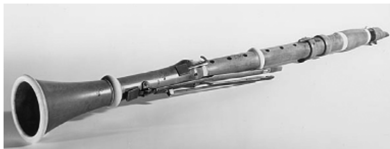
4. ábra: ötbillentyűs klarinét (Theodor Lotz, Bécs)

Ebben a formájában vált a klarinét Európa-szerte széles körben ismertté, s feltehetően ezt a hangszeret ismerte és használta Haydn és Mozart is. Ez a hangszer intonáció illetve a regiszterek és a különböző keresztfogásokkal megszólaltatott hangok kiegyenlítetttsége szempontjából még igencsak kezdetleges volt, csak kifejezetten jó hangszerrel rendelkező, kiemelkedően ügyes profi játékosok voltak