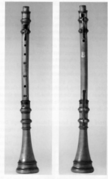
2. sz. ábra: J. C. Denner hárombillentyűs klarinétja

A fent említett J. C. Denner fia, Jacob Denner 1720 táján további újításokat eszközölt a klarinéton: az alsó végén egy új hanglyukat alakított ki, melyet egy hosszú billentyű segítségével, bal kisujjal lehetett működtetni, így megszólaltathatóvá vált a kis e hang. Ezzel együtt a váltólyuk kisebbre fűrése és a fúvókához közelebb helyezése h' helyett b' hangot eredményezett, miközben a h' megszólaltatása az új e hang átfúvásával vált lehetővé. Ilyenformán a klarinét alaphangsora már megegyezett a mai klarinétokéval: kis e – egyvonalas b. Ezenkívül az eddig hengeresen végződő hangszertestet ún. tölcsérrrel látta el. A hangszernek ez a hárombillentyűs változata volt a késő barokk korban használatos, ezt szokták ma „barokk klarinét” néven emlegetni (lásd 2. sz. ábra).