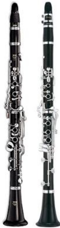
17. ábra: modern klarinét a) német rendszerű; b) francia rendszerű

három és fél oktáv. Színgazdag, változatos hangzása, különféle karakterek megelevenítésére való kiemelkedő képessége folytán a 20. században szinte mindenfajta zenei stílusnak kedvelt hangszerévé vált.