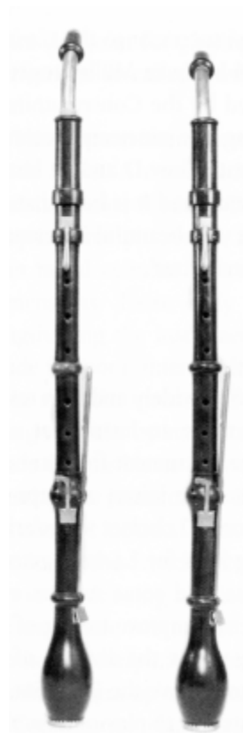
11. sz. ábra: ötbillentyűs clarinette d'amour (anon.)

A késő barokk kor egyik kísérlete volt a clarinette d'amour, jellegzetes hagymaformájú tölcserével, többnyire Asz, G vagy F hangolásban, mely azonban igen hamar kikopott a használatból, és a zenekari játékba – egy-két esettől eltekintve – sohasem vonult be (lásd 11. sz. ábra).