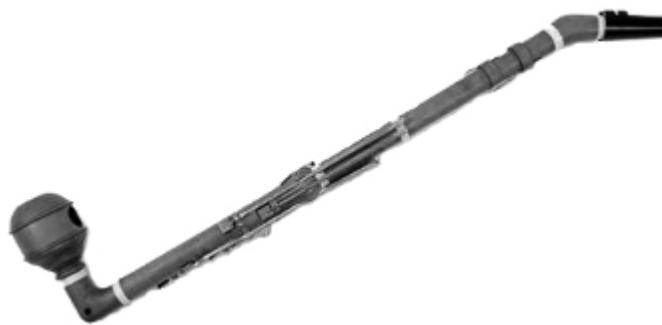
13. sz. ábra: basszetklarinét (Theodor Lotz Stadler számára készített hangszerének reprodukciója)

18. század végén alakult ki az a játékmód, amely máig használatos, a fűvóka megfordításával, és a nád alsó ajakra támasztásával. Német klarinétjátékosok kísérleteztek vele először, majd fokozatosan terjedt el Európa többi területén is, végül teljesen kiszorítva a gyakorlatból a régebbi, felső ajak által kontrollált játékmódot. 9