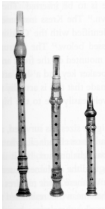
1. sz. ábra: tenor, alt és szoprán chalumeau

A ma klarinétként ismert hangszer feltalálása a 18. század elejére tehető. Elődje az úgynevezett chalumeau, amely elnevezés a görög calamos (latinul calamus), azaz nád szóból ered 2 . A chalumeau egy egyszerű, billentyűk nélküli, a középkor óta a népzeneben használatos hangszer volt, felső végén egy lyukkal, melyre egy nádnyelvet erősítettek, ennek rezgése képezte a hangot. Eredetileg a nádnyelv a hangszer elülső oldalán helyezkedett el, tehát a játékos felső ajka illeszkedett rá. Ennek a hangszernek a fúvókája még nem különálló alkatrész volt, hanem ugyanabból a csőből volt kialakítva, mint a hangszer teste. Hangterjedelme a kis f-től az egyvonalas a-ig tartott, és szinte csak az F-dúr skála törzshangjait tudta megszólaltatni (lásd 1. sz. ábra).