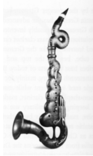
10. sz. ábra: basszusklarinét (Papalini, Chiaravalle)

A késő barokk kor egyik kísérlete volt a clarinette d'amour, jellegzetes hagymaformájú tölcserével, többnyire Asz, G vagy F hangolásban, mely azonban igen hamar kikopott a használatból, és a zenekari játékba – egy-két esettől eltekintve – sohasem vonult be (lásd 11. sz. ábra).