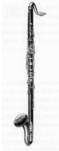
9. sz. ábra: basszusklarinét (Berthold, Speyer)