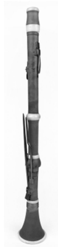
3b ábra: négybillentyűs klarinét hátulnézete