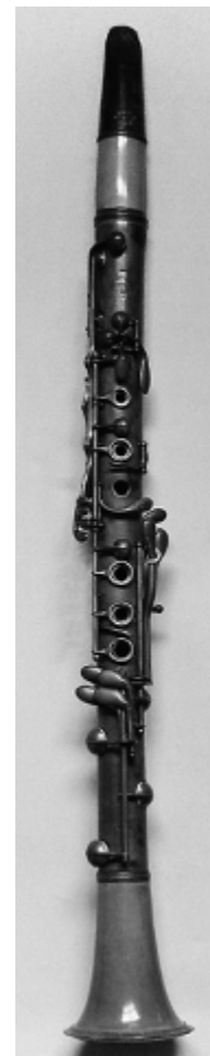
15. sz. ábra: Böhm-rendszerű klarinét

A mai, modern klarinét általában 13-20 billentyűvel rendelkezik 10 (lásd 17. sz. ábra). Bár fogásai, fogáskombinációi – az oktáv helyett duodecima-váltás és a kibővített alaphangsor miatt – komplikáltabbak, nehézkesebbek a többi fafúvós hangszerénél, a szabadon rezgő szimpla nádnyelvvel történő hangképzésnek köszönhetően technikailag a fúvós hangszerek legfürgébbjei, legvirtuózabbjai közé tartozik, csaknem utolérve a fuvolákat. 11 Hangterjedelme óriási, több mint