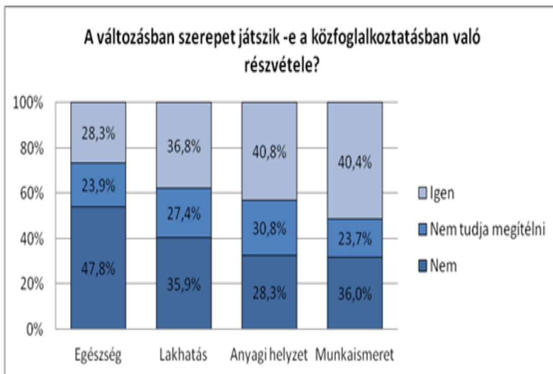
1. ábra A közfoglalkoztatás szerepe a jövőkép alakulásában

Az eredmények a következő diagramban foglalhatók össze: